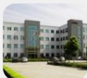
上海日揚 上海市寶山城市工業 園區城銀路51號