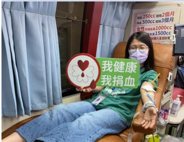
同仁響應捐血活動