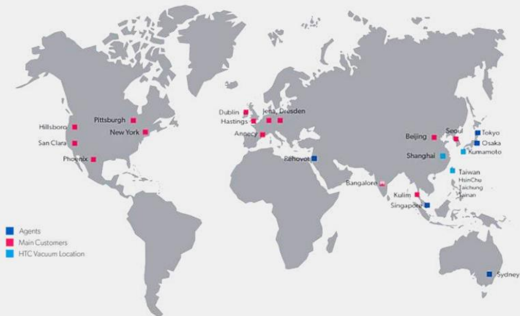
全球據點與主要客戶