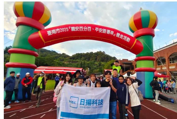
響應地方政府健康促進活動