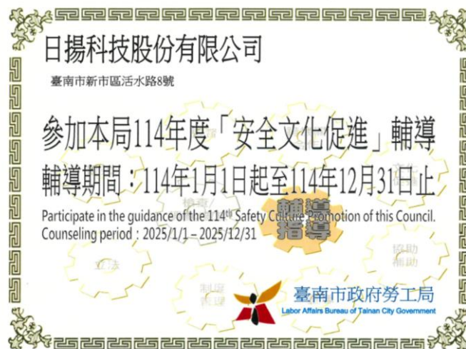
參與台南勞工局輔導活動