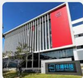
台南總公司 台南市新市區活水路8號