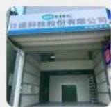
台中辦事處 台中市大雅區 中科路958號