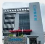
新竹營運中心 新竹縣湖口鄉 光復路32號